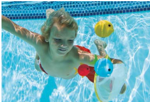
CÓDIGO: 22748/5 ACCESORIOS PARA BUCEO INTEX UNDERWATER FISHING SET 55506 UNIDADES X CAJA: 12

FABRICADOS CON MATERIAL FLEXIBLE PARA APORTAR MAYOR COMODIDAD Y SEGURIDAD DISEÑO PARA NIÑOS MAYORES DE 6 AÑOS DE EDAD