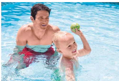
CÓDIGO: 23244/1 ACCESORIOS PARA BUCEO INTEX PELOTA 55505 UNIDADES X CAJA: 12

DISFRUTA DE TU JUEGO DE AVENTURA CON INTEX PESCA SUBMARINA DE PESCA. CONJUNTO DE 4 PIEZAS INCLUYE 3 PECES DE COLORES BRILLANTES: AZUL, ROJO Y AMARILLO INCLUYE RED DE FÁCIL DE USAR