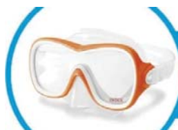
CÓDIGO: 25614/0 ANTIPARRA P/NATAACION INTEX NIÑOS 55978 UNIDADES X CAJA: 6

Está moldeado con la forma de la nariz para ajustarse mejor al rostro y que no haya filtraciones de agua