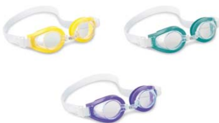
CÓDIGO: 25578/1 New! ANTIPARRA P/NATACION INTEX PLAY JUNIOR 55602 UNIDADES X CAJA: 6