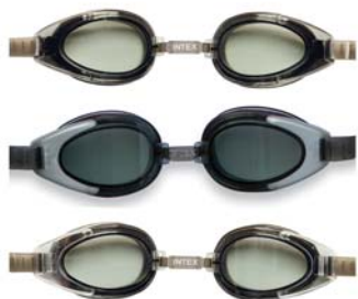
CÓDIGO: 10133/3 ANTIPARRA P/NATACION INTEX ANTI-NIEBLA 55685 UNIDADES X CAJA: 6