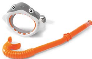
CÓDIGO: 23811/7 MASCARA P/BUCEO INTEX TIBURON C/SNORKEL 55944 UNIDADES X CAJA: 12