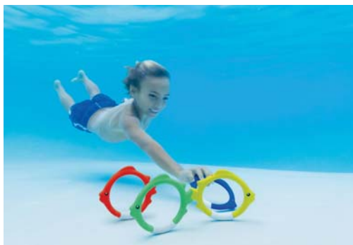
CÓDIGO: 23839/3 ACCESORIOS PARA BUCEO INTEX AROS SUMERGIBLES PECES 55507 UNIDADES X CAJA: 12

CADA BOLA INCLUYE UNA SERPENTINA DE NEOPRENO QUE SE MUEVEN EN EL AGUA FABRICADAS CON MATERIAL FLEXIBLE PARA APORTAR MAYOR FLEXIBILIDAD Y SEGURIDAD DISEÑO PARA NIÑOS MAYORES DE 6 AÑOS