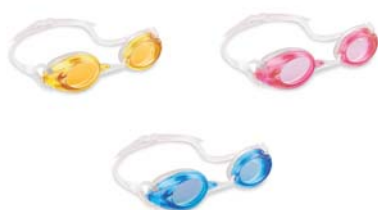
CÓDIGO: 23806/5 ANTIPARRA P/NATAACION INTEX SPORT RELAY 55684 UNIDADES X CAJA: 12