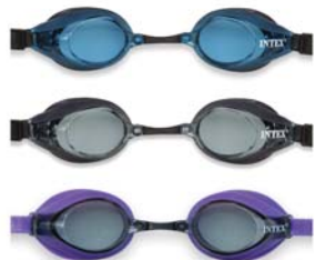
CÓDIGO: 17778/2 ANTIPARRA P/NATAACION INTEX RACING 55691 UNIDADES X CAJA: 12