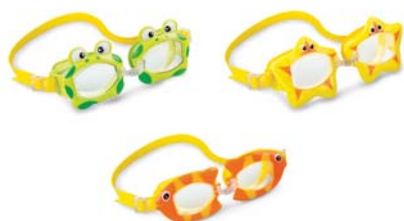
CÓDIGO: 23805/6 ANTIPARRA P/NATACION INTEX ESTRELLITA / PEZ / RANITA 55603 UNIDADES X CAJA: 12