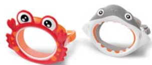
CÓDIGO: 23809/2 MASCARA P/BUCEO INTEX CANGREJO/ TIBURON 55915 UNIDADES X CAJA: 12