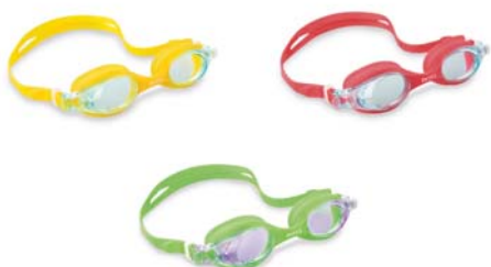
CÓDIGO: 23808/3 ANTIPARRA P/NATACION INTEX PRO TEAM 55693 UNIDADES X CAJA: 12