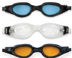
CÓDIGO: 23807/4 ANTIPARRA P/NATACION INTEX PRO MASTER 55692 UNIDADES X CAJA: 12