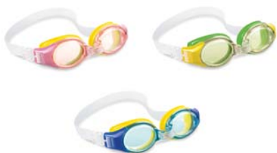
CÓDIGO: 23804/7 ANTIPARRA P/NATACION INTEX JUNIOR 55601 UNIDADES X CAJA: 12