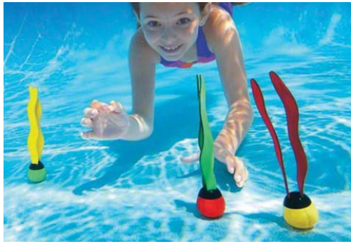
CÓDIGO: 21565/7 ACCESORIOS PARA BUCEO INTEX ALGAS SUMERGIBLES 55503 UNIDADES X CAJA: 24